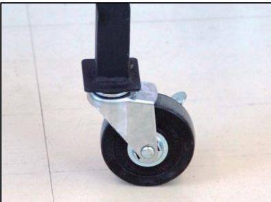
B-03・04用架台用キャスター (KD-CAS)

タイヤサイズ: φ75のキャスターで移動もラクラク、ストップパー付、4個セット。